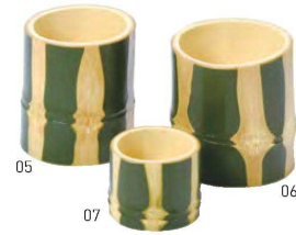
青塗はつり丸千代口

20-104-10(22204) フラット 820円 φ5.5~6×H4.5cm 20-104-11(22205) ハス切り 820円 約φ5.5~6×H4.5(2.5)cm ※ウレタン塗装 ※天然素材のためサイズにはバラツキがあります。