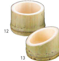
丸竹千代口(無塗装)

20-104-07(27642) 3,100円 約φ5.5~6×H4.5cm ※ウレタン塗装 ※天然素材のため径には大きくバラツキがあります。