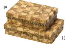
竹皮弁当箱<内側紙貼> 網代

※材質:竹皮+紙(コーティング加工) ※耐水・耐油形状ではありません。 ※高温の食材へのご使用はお避けください。