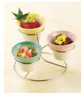
ワイヤーリングスタンド ➤ P284参照