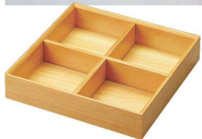
木和美・ミニ松花堂弁当 (四ツ仕切付) 積重 20-126-03(27058) 4,100円 約21×21×H4.8cm / 内寸約19.6×19.6×H4cm (1柄内寸約9.4×9.4cm / 仕切約H3.5cm) ※身・仕切セット ※蓋は付いておりません。 ※材料の特性上節や黒いスジが入ることがあります。