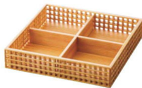
新・細目格子盛器 四ツ切 20-126-01(27586) 20,000円 約21.2×21.2×H4.4cm / 内寸約20×20×H3.8cm (1柄内寸約9.6×9.6cm / 仕切約H3.2cm) (27585) 身 18,500円 (27586) 仕切のみ 1,500円 ※身・仕切セット ※蓋は付いておりません。※材質:秋田杉