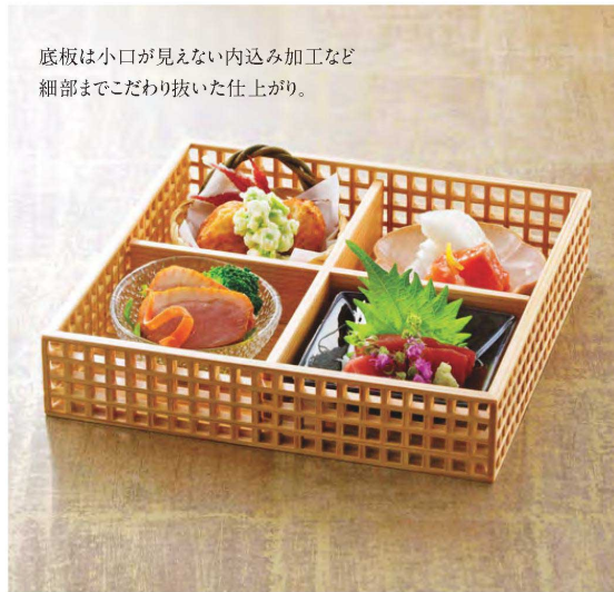
底板は小口が見えない内込み加工など細部までこだわり抜いた仕上がり。