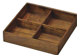
木和美・ミニ松花堂弁当 身 (仕切付) 積重 20-126-04(27507) 4,100円 約20.5×20.5×H4.8cm / 内寸約19.5×19.5×H4cm (1柄内寸約9.5×9.5cm / 仕切約H3.5cm) ※身・仕切セット ※蓋は付いておりません。