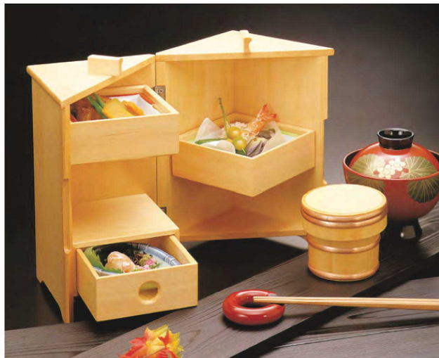
檜・書院弁当(小) 受注 20-136-03(27151) 22,000円 約13.5×13.5×H23cm (上・中段内寸約9.4×9.4cm / 下段内寸約9.3×8.3cm)