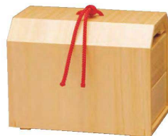
檜・数寄屋弁当(大) 受注 20-136-04(27283) 12,300円 約18×11.4×H13.8cm / 内箱外寸1段約16.5×9.8×H4.5cm / 内箱内寸約15.3×8.5×H4.2cm