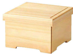
檜・開き二段弁当 受注 20-136-01(27176) 18,000円 約21×21×H13.5cm (上段1棚内寸約7.9×7.9×H4.4cm / 下段内寸約16×16×H4.4cm)