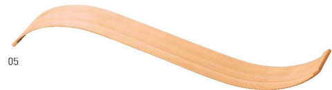
大館曲げわっぱ 波板盛皿