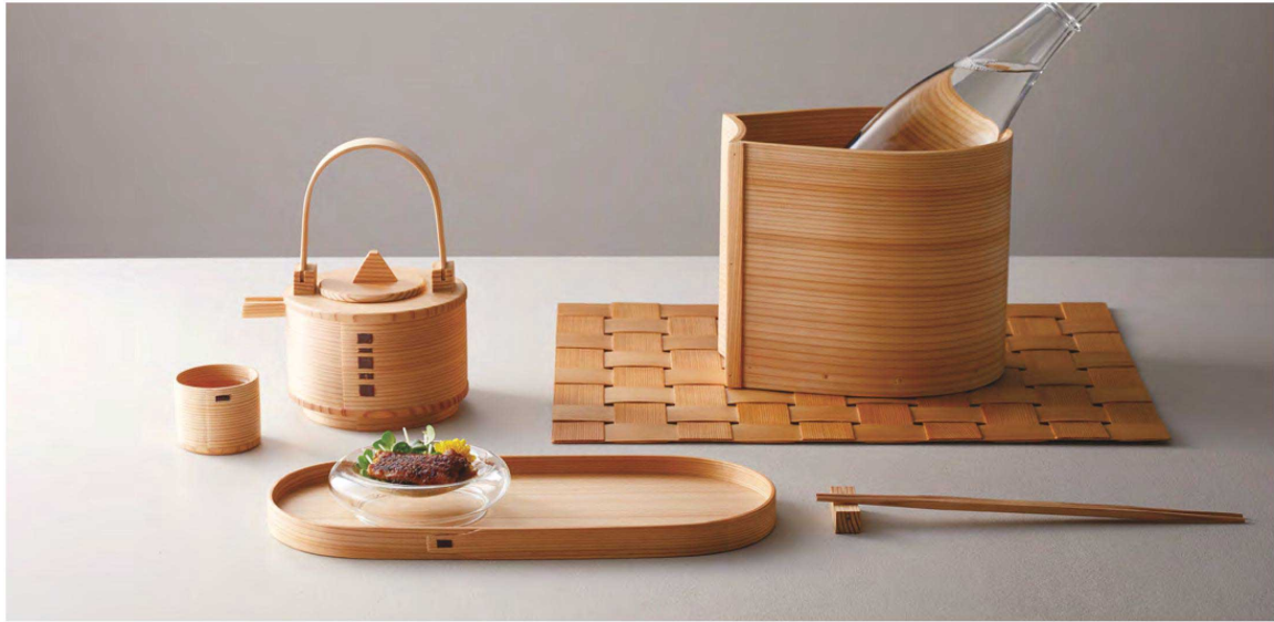
ちろり千代口 ▶ P288参照 クーラー ▶ P287参照 網代まっと ▶ P448参照 トレイ ▶ P437参照

「大館曲げわっぱ」は秋田の杉を使い、2000年もの間、製法を変えずに作られてきた伝統工芸品です。杉独特の肌触りや柾目(まさめ)の美しさ、機能性の高さは逸品です。