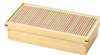
桧 糸格子盛器 (深型)

20-170-02 (27538) 11,440円 約26×13×H6.5cm (セット内容) 格子蓋 (枠・格子分離型) : 約26×13×H2cm ガラス : 約24.6×11.7×H0.3cm 身(スタッキング可) : 約24.8×11.8×H5cm (内寸約23.3×10.4×H4cm)