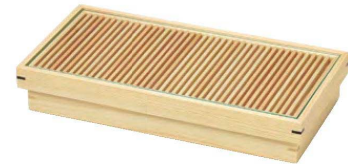
桧 糸格子盛器 (浅型)

20-170-01 (32099) 10,570円 約26×13×H4.5cm (セット内容) 格子蓋 (枠・格子分離型) : 約26×13×H2cm ガラス : 約24.6×11.7×H0.3cm 身(スタッキング可) : 約24.8×11.8×H5cm (内寸約23.3×10.4×H1.7cm)