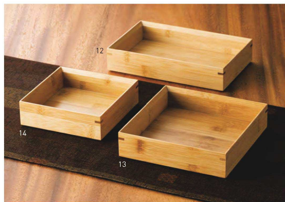
竹・料理箱(クリアー) 積重

20-175-10(18264) 正角5寸 4,900円 約16×16×H4.2cm / 内寸約14.8×14.8×H2.5cm