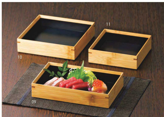
竹・料理箱(内黒) 積重

20-175-08(38515) 4,150円 約22.7×13×H3cm / 内寸約21.5×11.7×H1.5cm