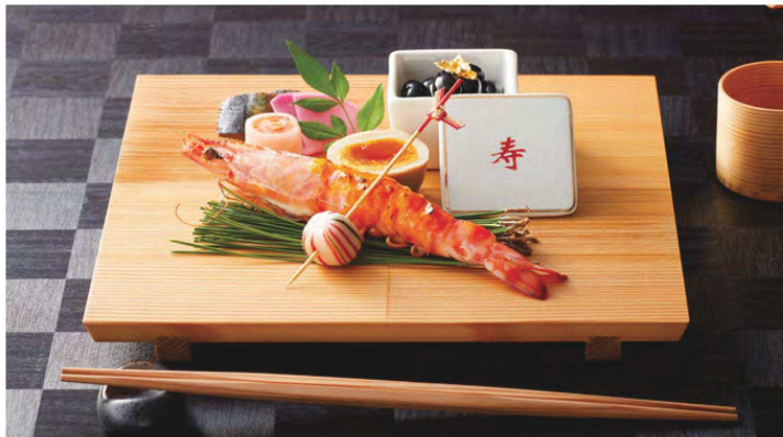
プラスチックにより浮きたつ市松模様が美しい盛器