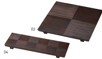
木曾杉・市松盛器 古代色