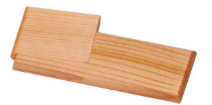
EX polymer EXポリマー塗装