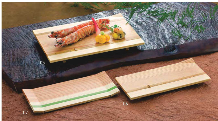
杉と竹のコンビネーションが生み出す美しさ。