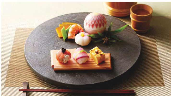
うづくり加工を施した板を組み重ね懐数を表現しました。職人の確かな技術を感じる逸品です。珍珠皿や指拭きなどに