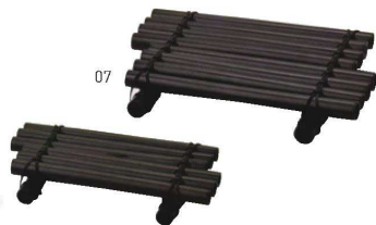
竹端材筏盛(黒塗ツヤ消し)