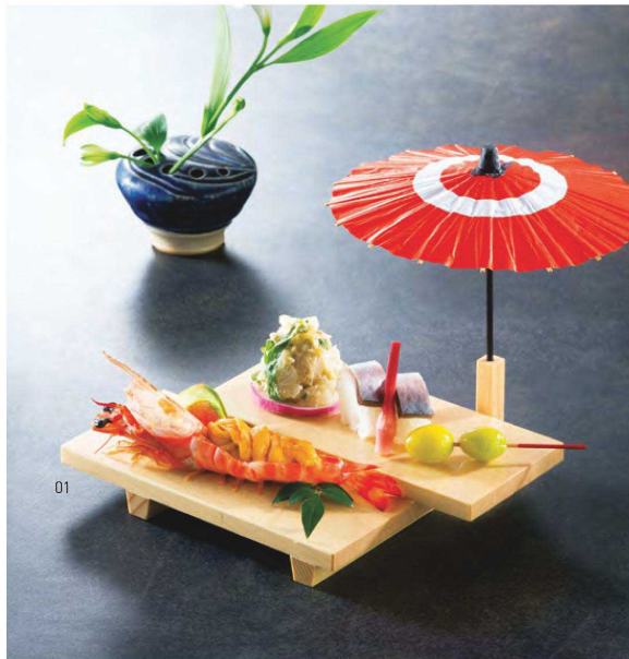
白木段違い八ッ橋セット