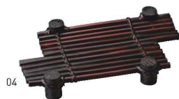
新・竹製八ッ橋 染竹