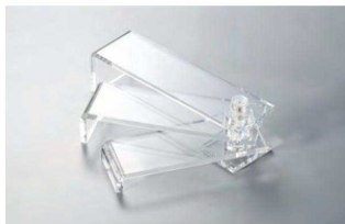
アクリル立体盛付台

20-195-01 (30157) 5,000円 収納時約18×5×H5.6cm 上段約18×3×H5cm / 中段約16×5×H3.5cm / 下段約14×5×H2cm