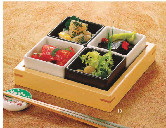
白木市松専用トレイ

20-202-11(26606) ヒワ吹 230円 約5.7×5.7×H3.7cm 20-202-12(26605) 黄吹 230円 約5.7×5.7×H3.7cm 20-202-13(26604) ピンク吹 230円 約5.7×5.7×H3.7cm 20-202-14(26615) コバルト吹 230円 約5.7×5.7×H3.7cm 20-202-15(26726) 黒マット 200円 約5.7×5.7×H3.7cm 20-202-16(26725) 白 200円 約5.7×5.7×H3.7cm 20-202-17(26618) 吹墨 230円 約5.7×5.7×H3.7cm ※マット=ツヤ消し ※輸入陶器(小箱10ヶ入)