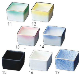
陶器・角型珍珠入

20-202-10(16180) 1,800円 約18.8×7×H2.5cm / 内寸約17.5×5.8×H1.8cm ※陶器は別売です。下記角型珍珠入からお選びください。