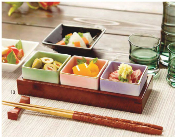
陶器角型珍珠入用カスター台

20-202-06(26460) 黒 960円 約8×8×H2.3cm 20-202-07(26461) 白 960円 約8×8×H2.3cm 20-202-08(26462) ピンク 960円 約8×8×H2.3cm 20-202-09(26463) ブルー 960円 約8×8×H2.3cm