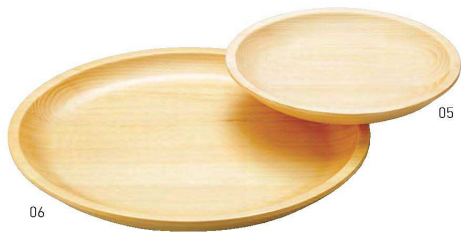
EX polymer EXポリマー塗装 檜・丸皿(東濃ひのき) 積重 20-212-05(32186) 小 4,350円 約φ18×H2.8cm 20-212-06(32187) 大 6,600円 約φ27×H2.8cm ※EXポリマー塗装 > P22参照