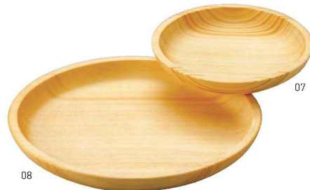
EX polymer EXポリマー塗装 白木・スタッキング 積重 20-212-07(38430) 口取皿 4,350円 約φ18×H3cm 20-212-08(38431) ディナー皿 6,800円 約φ27×H3.2cm ※EXポリマー塗装 > P22参照