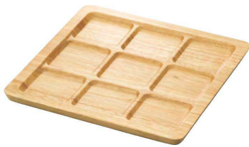
天然木スクエアプレート 9ツ仕切 積重 20-212-01(32018) 5,000円 約25×25×H2cm / 1割内寸(底)約6×6cm ※材質:ラバーウッド ※ウレタン塗装