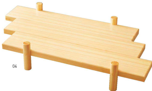
桧・盛込“望川”クリアー