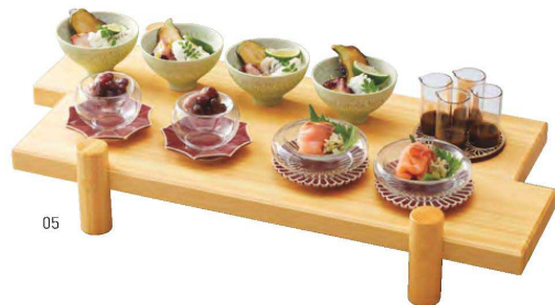
桧・盛込“臨川”クリアー