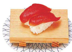
ミニ長角盛台(すべり止め付)