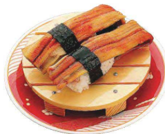
白木寿司皿(B)(すべり止め付)

20-230-06(30351) 1,300円 約12×9×H2cm ※すべり止め加工はしてありません。