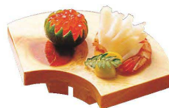
桧・紅節ミニ盛台 扇型(すべり止め付)

20-230-08(25759) 1,450円 約14.5×9.5×H2.5cm