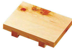
桧ミニ紅節長角盛台(すべり止め付)