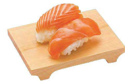
東濃檜・盛皿ミニ

20-230-06(30351) 1,300円 約12×9×H2cm ※すべり止め加工はしてありません。