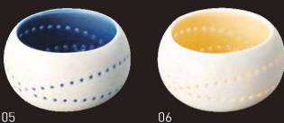
色ほたる珍珠入 丸

20-256-03(27821) 紺 520円 約φ4.9×H3.3cm 20-256-04(27822) 山吹 520円 約φ4.9×H3.3cm ※輸入陶器(小箱10ヶ入)