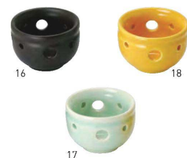
陶器・花の和珍味入