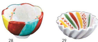
十草三ツ足珍味入