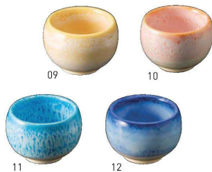
二色吹き丸型珍味入