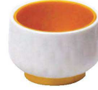
樹脂カップ 雅(みやび)小鉢 20-272-05(32470) 200円 約φ5.2×H3.5cm ※PE(ポリエチレン)