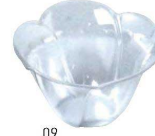
ワンウェイ・プラ小鉢 梅(200個入) 20-272-07(27805) 金 7,500円 (1ヶ当り37.5円) ※材質:耐熱HIPS ※耐熱温度:+80~-20℃ 20-272-08(27806) 黒 4,700円 (1ヶ当り23.5円) ※材質:HIPS ※耐熱温度:+60~-0℃ 20-272-09(27807) クリア 4,700円 (1ヶ当り23.5円) ※材質:PET ※耐熱温度:+80~-5℃ 約φ5×H2.8cm ※材質によりそれぞれ耐熱温度が異なります。