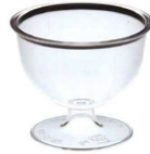
樹脂カップ プチワイン 20-272-03(32473) 55円 約φ5.5×H4.5cm ※PS(ポリスチレン)