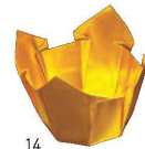
両面OP珍味入(200枚入) 20-272-12(66392) 白雲竜(小) 8,000円 約7×7×H5.5cm (1枚当り40円) 20-272-13(66395) 紅梅雲竜(小) 8,000円 約7×7×H5.5cm (1枚当り40円) 20-272-14(66398) 双金(小) 9,000円 約7×7×H5.5cm (1枚当り45円)