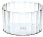
樹脂カップ クリスタル 20-272-01(32471) 95円 約φ5.9×H3.6cm ※PS(ポリスチレン)