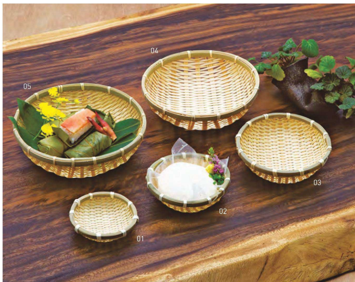
おわん型竹ザル 白