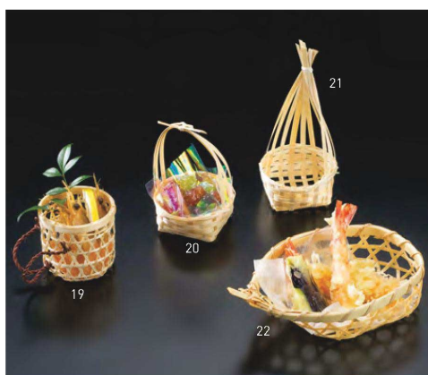
竹珍味籠 しょうご付