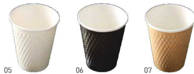
紙カップコップ (50個入)