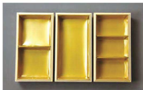
金色紙中子7寸用 (23465)4割 (23464)2割 (23466)6割