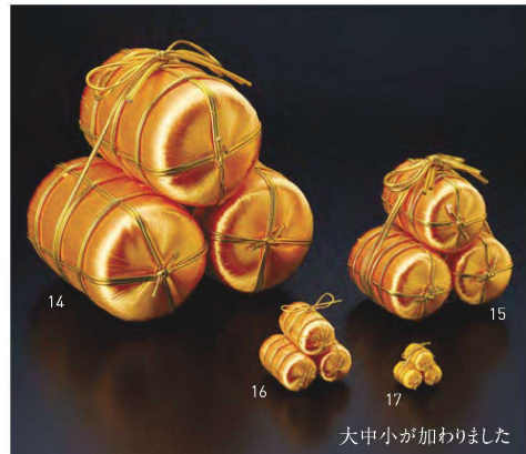
大中小が加まりました