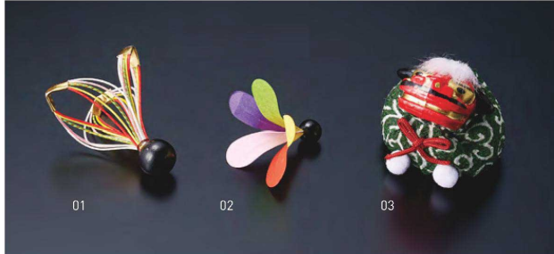
ミニ水引羽根飾り