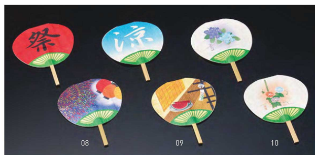
飾りミニうちわ (両面PPラミ) (50枚入)

20-341-08 (63104) 祭/花火 4,400円 (1枚当り88円) 20-341-09 (63105) 涼/風鈴 4,400円 (1枚当り88円) 20-341-10 (63106) 紫陽花/朝顔 4,400円 (1枚当り88円)