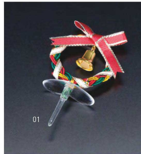
水引クリスマスピック リース (5本入)

20-341-01 (25688) 800円 約5×L8cm (1本当り160円)