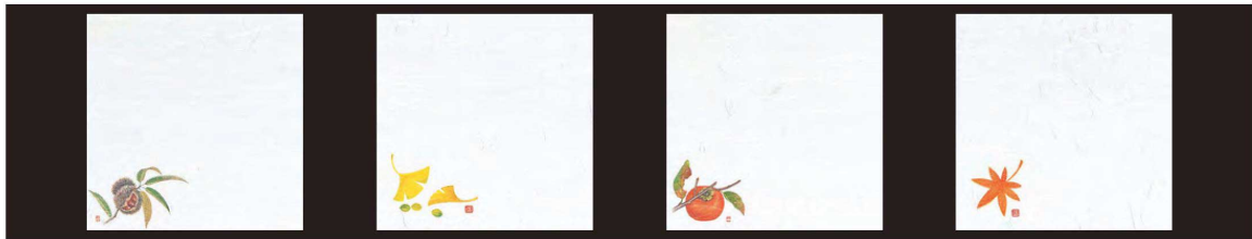
20-372-05(65001) くり(8月~10月) 20-372-06(64424) ざんなん(9月~11月) 20-372-07(65002) かき(9月~11月) 20-372-08(64425) もみじ(10月~11月)