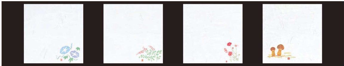
20-372-01(64826) あさがお(7月~8月) 20-372-02(64827) はぎ(8月~9月) 20-372-03(64829) こすもす(8月~9月) 20-372-04(64423) まつたけ(8月~10月)