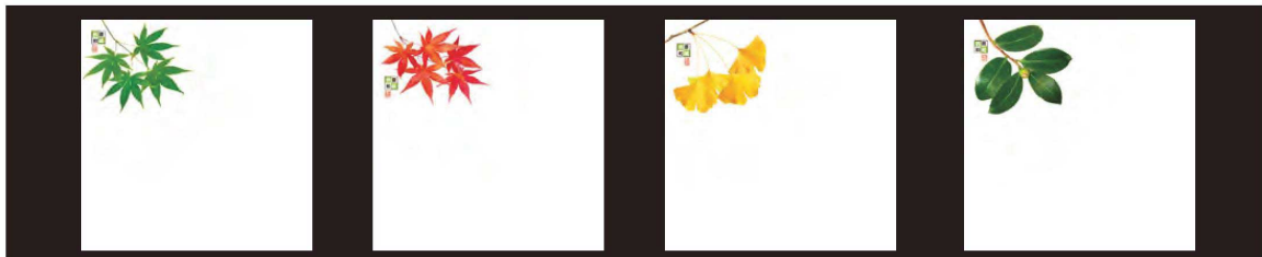
20-372-18(66783) 青もみじ 20-372-19(66784) 赤もみじ 20-372-20(66785) いちょう 20-372-21(66786) 樺

【ご使用上の注意】 食用色素インキを使用しておりませんので、直接お料理を盛りつける時は、必ず印刷部分を選けるかOPクリアシートをご使用ください。 ※上記価格は税抜き価格です。