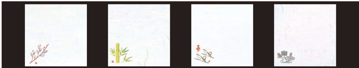
20-372-13(64803) ねこやなぎ(12月~2月) 20-372-14(65109) 笹竹 20-372-15(65286) 寿鶴 20-372-16(65287) はす