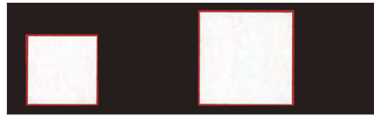
20-375-01(65760) 正角(小) 2,500円 (1組当り25円) 20-375-02(65761) 正角(大) 3,000円 (1組当り30円) 約9×9cm 約12×12cm