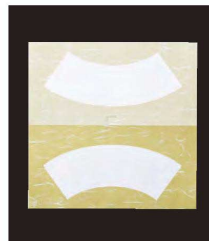
※上記が商品の出荷状態です。 (約18.2×18cm)