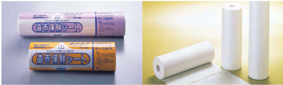
遠赤保鮮シート ロールタイプ(100枚入)

20-411-01 (64902) L (ミシン目入) 3,500円 約38.5×24cm 20-411-02 (64901) M (ミシン目入) 2,650円 約27.5×24cm