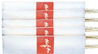
うたげ 宴 寿(赤) 5膳入