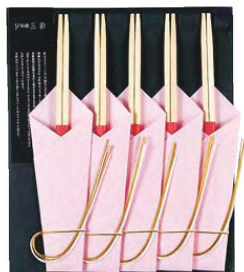
うらら 麗 桃 5膳入