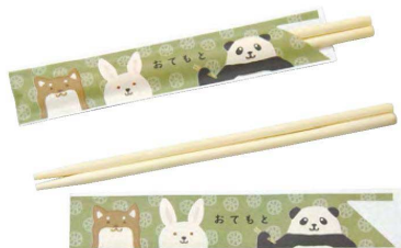
子供箸(アスペン・袋入) (50膳入)

20-417-08(15539) 1,350円 箸約L18cm (1膳当り27円)