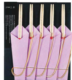
うらら 麗 藤 5膳入