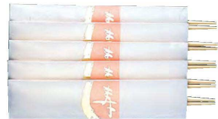
うたげ 宴 寿(桃) 5膳入