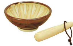
ごますりくん(ひのぎすりこぎ付)

20-432-16(16102) 740円 約φ3×L22cm / 容量約10ml ※無塗装