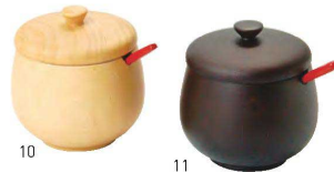
木製・蓋付丸型薬味入

20-432-10(19190) ナチュラル 2,100円 ※薬味スプーン(大)ナチュラル(19192)付 20-432-11(19191) ダークブラウン 2,100円 ※薬味スプーン(大)杵目(19193)付 約φ7.5×H7.5cm 薬味スプーン(約L8.7×1.5cm)付