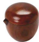
木製・醤油差し(杵目)

20-432-12(19192) ナチュラル 260円 20-432-13(19193) 杵目 260円 約L8.7×1.5cm