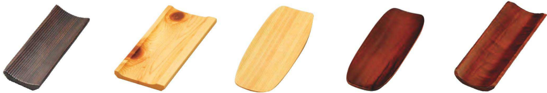
焼杉・スリムおしぼり受け

20-433-05(16158) ひのき 1,350円 約19×7.5cm 20-433-06(16204) 樺(クリアー) 1,460円 約19×7.2cm 20-433-07(16205) 樺(茶) 1,300円 約19×7.2cm