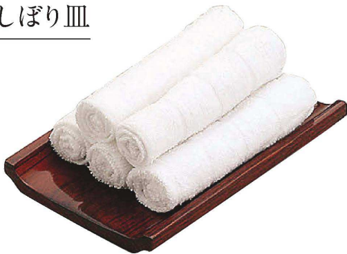
ステンレス楕目 おしぼり受け(マット)

20-433-01(16239) 1,100円 約19×6×H1.5cm / 厚み約0.9mm