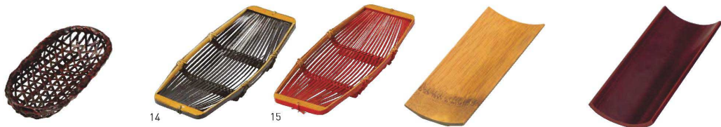
ランタイ風おしぼり皿 小判