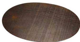
本漆荒肌多目的トレイ 楕円