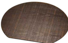
本漆荒肌多目的トレイ 半月

20-443-08(15527) 2,700円 約36.2×33.2×H0.7cm