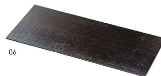
桐・荒彫板 会席膳