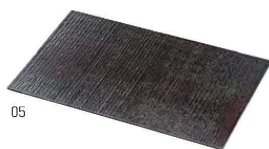
桐・荒彫板 ミニマット