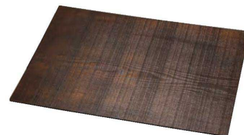
本漆荒肌多目的トレイ 長角