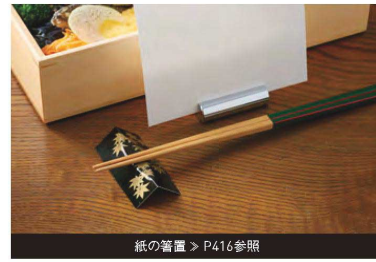
紙の箸置 > P416参照