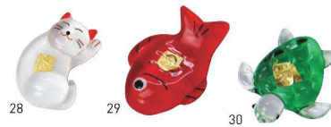
28 29 30