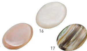
15 16 17