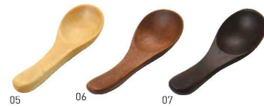
05 06 07