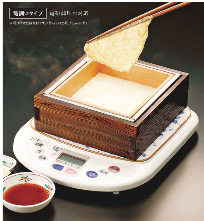
電調®タイプ 電磁調理器対応

20-060-02(21334) 25,800円 外寸約24.3×23×H8cm / 内寸約18.3×16.8×H6.2cm ※ステンレスバネの強度上、電磁調理器100V専用です。 ※湯煎式 ※直火不可