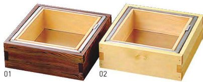
電調焼杉枠湯葉鍋2~4人用(UB-104型)

20-060-01(21329) 25,800円 外寸約24.3×23×H8cm / 内寸約18.3×16.8×H6.2cm ※ステンレスバネの強度上、電磁調理器100V専用です。 ※湯煎式 ※直火不可