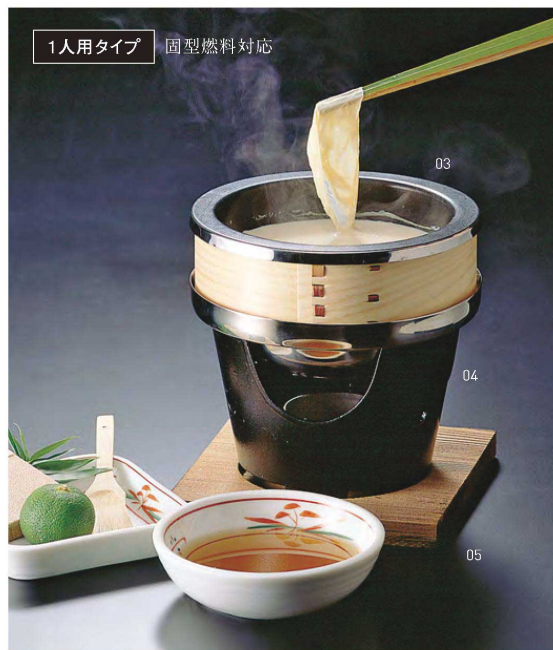
1人用タイプ 固型燃料対応