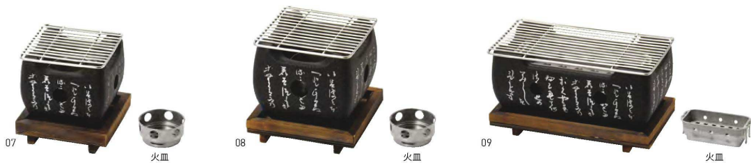
アルミ・正角黒コンロ(小)セット