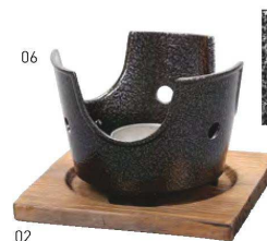
用美アルミニコンロ(いぶし銀)火皿付