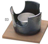
アルミ・ミニコンロ火皿付敷板付