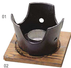
用美アルミニコンロ(火皿付)