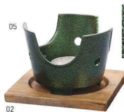
用美アルミニコンロ(いぶし緑)火皿付