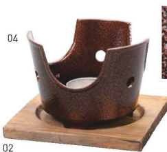
用美アルミニコンロ(いぶし銅)火皿付