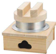
ニュー檜・釜めしセット