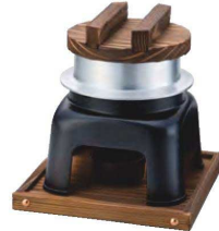
ニュー釜めしかまどセット