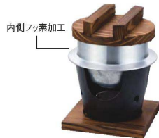
ニューふる里釜セット(内側フッ素加工)