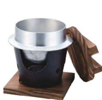
ニューふる里釜セット