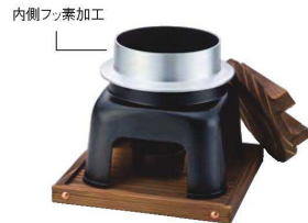
ニュー釜めしかまどセット(内側フッ素加工)