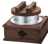
ニュー焼杉・釜めしセット