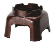
かまど(いぶし銅) 20-070-11 (20383) 2,330円 約17×17×H12cm