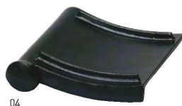
単体でお皿としても

20-073-04(20418) 3,850円 約15×16×H3.7cm ※コンロ・火皿・敷板別売