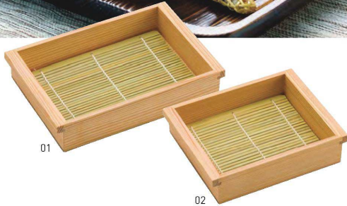
杉・おほこ長角盛箱(竹ス付) 積重 20-083-01(18117) 大 4,680円 約20.5×13.7×H4cm ※竹スダレ(約17.8×12.5cm)付 20-083-02(18118) 小 4,420円 約17×13.7×H4cm ※竹スダレ(約14.3×12.5cm)付 ※本体塗装付