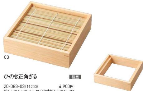
ひのぎ正角ざる 積重 20-083-03(11200) 4,900円 約18.8×18.8×H5.5cm / 内寸約17.2×17.2cm ※竹スダレ(約17×17cm)付 ※本体塗装付