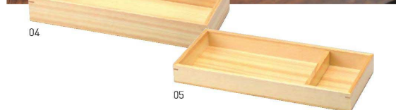
削・長角料理箱 深 積重 削・長角料理箱 浅(仕切板付) 積重