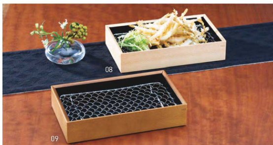
木製・天ぷら盛皿(ステンレス目皿付) 積重