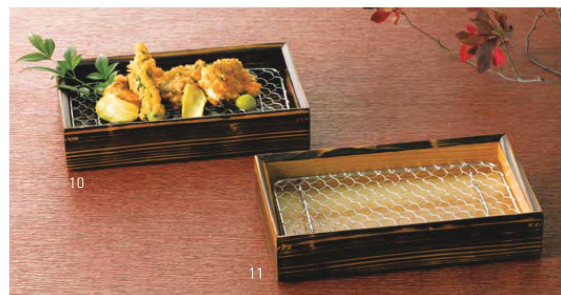
焼杉・天ぷら盛皿(ステンレス目皿付) 積重