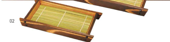
焼杉・舟形盛皿(大) ※竹ス付 積重