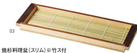
焼杉料理盆(スリム) ※竹ス付