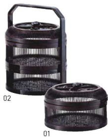
千筋料理箱 20-096-01 (22634) 1段 12,400円 約φ14×H9.2cm 20-096-02 (22635) 2段(手付) 18,400円 約15×φ14×H19cm