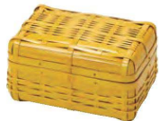
菱木編み竹籠(小) 20-096-04 (22709) 19,000円 約17×12×H10cm / 身約H7cm