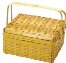
菱木編み竹籠(大・手付) 20-096-03 (22708) 49,000円 約28×22×H15.5(25)cm / 身約H12.8cm