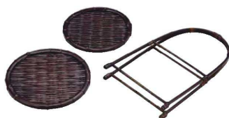
ワンタッチ あげぼの二段籠

20-098-05(24986) 大 6,550円 約φ21(φ18)×H32cm 20-098-06(24985) 小 5,450円 約φ18(φ15)×H32cm