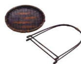
ワンタッチ あげぼの籠

※持ち手が取り外せますので収納に便利です。 ※持ち手付と持ち手なしのツーウェイに使えます。