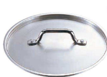
⑦ TKG PRO (プロ) 鍋蓋 (ANB-24)