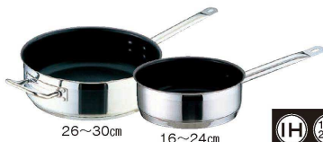
④ TKG PRO (プロ) エクスカリバー 片手浅型鍋 (蓋無) (AKT-92)