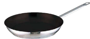
⑥ TKG PRO (プロ) エクスカリバー フライパン (AHL-M9)