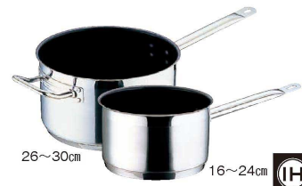
③ TKG PRO (プロ) エクスカリバー 片手深型鍋 (蓋無) (AKT-91)