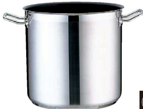
① TKG PRO (プロ) エクスカリバー 寸胴鍋 (蓋無) (AZV-67)