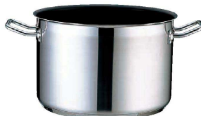
② TKG PRO (プロ) エクスカリバー 半寸胴鍋 (蓋無) (AHV-65)