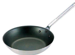
⑧ DON FCフライパン (AHL-F6) U