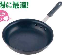
① TKG 硬質アルマイトフライパン (AFL-08)