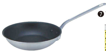
⑦ アルミプロマイスター CT フライパン (AHL-I6) V