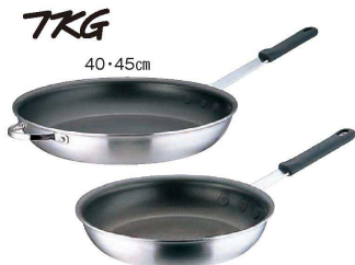
④ フライパン セレクト アルミ TKG (AHL-M3)