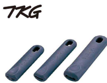
⑤ TKG フライパン用 カールハンドル (AHL-N0)