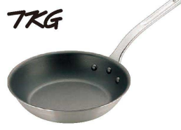
② TKG キャスト ノンステックフライパン (AHL-W7)