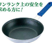
⑩ ウェアエバー エバースムーズ フライパン (セラミックガード) (AHL-S1)