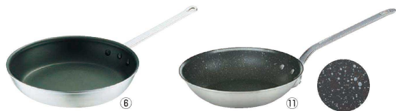
⑥ テフロン セレクトフライパン (AHL-P5)

④フライパンセレクトアルミTKG ⑥テフロンセレクトフライパンに合うフライパンカバーはP.2635(資料集15)、P.2636(資料集16)を参照ください。