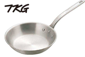
③ TKG キャスト フライパン (AHL-W6)