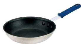
⑨ ウェアエバー セラミックガード フライパン (AHL-B2)