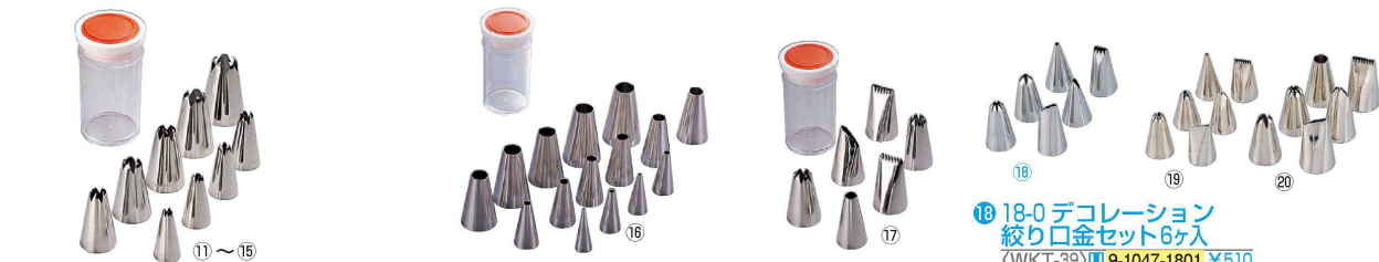
⑪ ケース入 18-8 口金セット