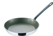
⑬ モービル シルバーストーン フライパン (AHL-13) ㊦