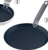
③ TKG アルミ厚板 ノンスティック クレーパン 25cm