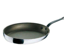
⑭ モービル シルバーストーン オーバルパン (AOC-04) ㊦