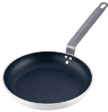
① TKG アルミ厚板 ノンスティック フライパン (AHL-AB)