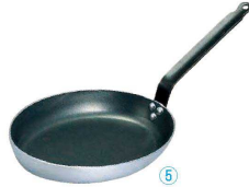
de Buyer アルミ ノンスティック