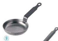
⑨ de Buyer 鉄 ミニフライパン 5140 (AHL-22) ㊦ 9-0105-0901 ¥3,500