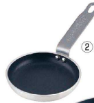
② TKG アルミ厚板 ノンスティック ミニフライパン 12cm