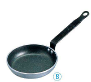
⑧ ミニフライパン 8140 (AHL-B1) ㊦