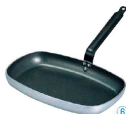
⑥ 角フライパン 8184-38 (AHL-B0) ㊦ 9-0105-0601 ¥30,000