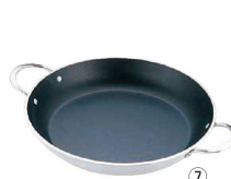
de Buyer アルミ ノンスティック