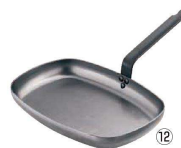
⑫ de Buyer 鉄 角フライパン 5550 (AHL-21) 9-0105-1201 ¥17,000