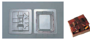
⑨ チョコレートモルド ボックス型 EU-648 〈WTY-78〉 9-1063-0901 ¥28,000 155×120×H60