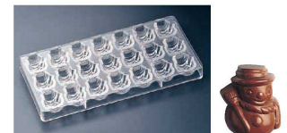
⑰ チョコレートモルド スノーマン 21PCS DRC-1333 〈WTY-85〉 9-1063-1701 ¥8,600 275×135×H24 できあがり容量:約12g