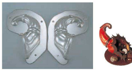
⑧ チョコレートモルド ホーン型 EU-735 (両面合わせ) 〈WTY-77〉 9-1063-0801 ¥44,000 φ130×250×H150

フランス デコレーフ社が送る新提案 チョコレートモルド ※⑧~⑪ ※写真は全て出来上がり見本です。 ⑧~⑪材質:PET樹脂