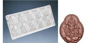
④ 像 10PCS 901608 〈WTY-E7〉 9-1063-0401 ¥7,800 出来上がり寸法:55×45×H7 出来上がり容量:約11g