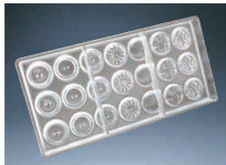
⑥ ボタン 21PCS 901662 〈WTY-E9〉 9-1063-0601 ¥7,800 出来上がり寸法:φ31×H8 出来上がり容量:約5g ●7種類のチョコレートが作れます。