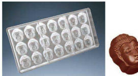
⑤ 大仏 21PCS 901661 〈WTY-E8〉 9-1063-0501 ¥7,800 出来上がり寸法:27×35×H19 出来上がり容量:約10g