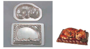
⑪ チョコレートモルド ネコ EU-698 〈WTY-76〉 9-1063-1101 ¥25,000 170×130×H70