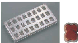
⑫ チョコレートモルド ハートA 24PCS C-1023 〈WTY-79〉 9-1063-1201 ¥8,600 275×135×H24 できあがり容量:約10g