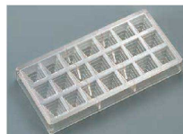
⑯ チョコレートモルド ピラミッド 21PCS DRC-1260 〈WTY-84〉 9-1063-1601 ¥8,600 275×135×H24 できあがり容量:約8g