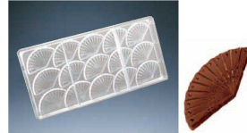
③ 扇子 15PCS 901437 〈WTY-E6〉 9-1063-0301 ¥7,800 出来上がり寸法:63×35×H3 出来上がり容量:約5g