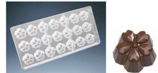
⑦ サクラ 21PCS 901918 〈WTY-F0〉 9-1063-0701 ¥7,800 出来上がり寸法:31×30×H15 出来上がり容量:約9g