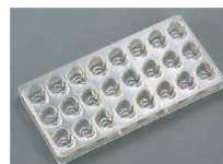
⑬ チョコレートモルド クラウン 24PCS DRC-1028 〈WTY-80〉 9-1063-1301 ¥8,600 275×135×H24 できあがり容量:約9g