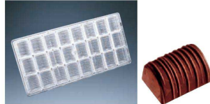
② プッシュドノエル 24PCS 901393 〈WTY-E5〉 9-1063-0201 ¥7,800 出来上がり寸法:36×26×H18 出来上がり容量:約18g