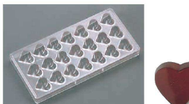
⑮ チョコレートモルド ハートB 21PCS DRC-1218 〈WTY-83〉 9-1063-1501 ¥7,300 275×135×H24 できあがり容量:約7g