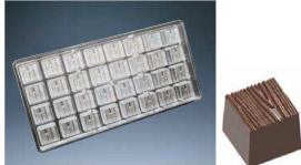
① キューブ 32PCS 901676 〈WTY-E4〉 9-1063-0101 ¥7,800 出来上がり寸法:約22×22×H19 出来上がり容量:約11g