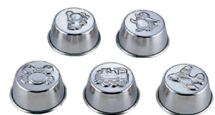
19 OD 18-8 プリンカップ (WPL-41) ¥ 440