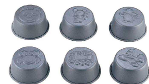
17 フッ素加工 プリンカップ (WPL-40) ¥ 440