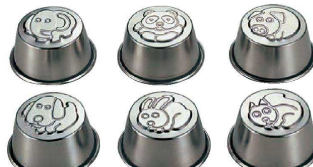
18 18-8 なかよし プリンカップ (WPL-10)