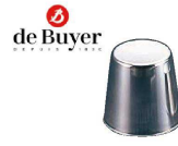
13 デバイヤー 18-10 プリンカップ (WPL-19)