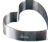
3 18-8 ハート型セルクル PP-632