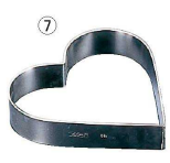
7 マトファ ハートリング (WHC-01)