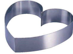
4 18-8 ウェディングケーキ用リング (NLV-13)