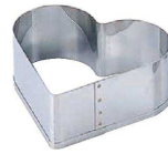
18-8 刃付セルクルリング