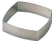
12 正方A型 (WDB-68) 内