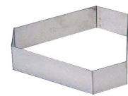
18 三角B型 (WDB-73) 内