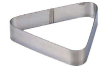
19 三角C型 (WDB-74) 内