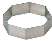
13 八角型 (WDB-67) 内