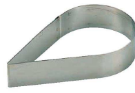
14 ティアドロップ型 (WDB-66) 内