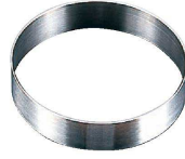
2 18-8 丸型セルクル (WSL-29) 目