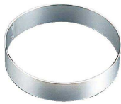
1 アルミ トルテリング (WTL-28)