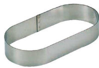
16 小判型 (WDB-64) 内