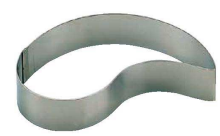
15 コンマ型 (WDB-65) 内