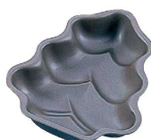
8 ブラック・フィギュア ケーキ焼型 もみの木 D-081

9-1090-0701 SN6806 大 内168×168×H127 ¥3,700 9-1090-0702 SN6808 中 内131×131×H100 ¥2,460 9-1090-0703 SN6805 小 内81×81×H60 ¥1,100 材質:アルミ合金・フッ素樹脂加工