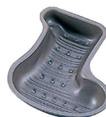
9 ブラック・フィギュア ケーキ焼型 プレゼントソックス D-082

〈WKC-J2〉 目 9-1090-0801 ¥1,800 内220×180 材質:ティンフリースチール・フッ素加工