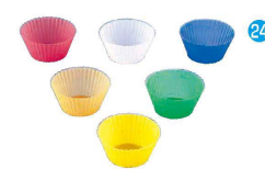
24 シリコン マフィンインサート レギュラー 12枚組セット 目

〈WMH-28〉 目 9-1090-2301 ¥1,800 φ50×H20 耐熱温度:-40℃～250℃