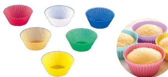
23 シリコン マフィンインサート 24枚組セット 目

〈WSL-90〉 目 9-1090-2101 M 59612 70×41×H24 ¥800 9-1090-2102 L 59613 90×52×H30 ¥1,000