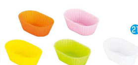
21 オーバル(5色セット) 目

〈WSL-89〉 目 9-1090-2001 M 59610 φ60×H27 ¥800 9-1090-2002 L 59611 φ70×H32 ¥1,000