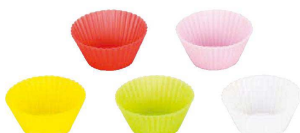
20 ラウンド(5色セット) 目

〈WSL-89〉 目 9-1090-2001 M 59610 φ60×H27 ¥800 9-1090-2002 L 59611 φ70×H32 ¥1,000