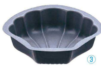
3 アルブリット シェル型 No.5163

〈WLK-03〉 目 9-1090-0201 ¥900 内122×108×H33 約300c.c. 材質:アルミニウム・フッ素樹脂2コート