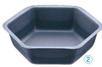
2 アルブリット 六角型 No.5164

〈WHS-01〉 目 9-1090-0101 ¥850 内116×112×H33 約220c.c. 材質:アルミニウム・フッ素樹脂2コート