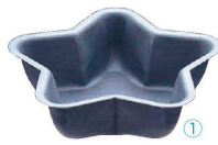
1 アルブリット 星型 No.5160

〈WHS-01〉 目 9-1090-0101 ¥850 内116×112×H33 約220c.c. 材質:アルミニウム・フッ素樹脂2コート