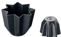
7 アルミ 八星ケーキ型 〈WYT-01〉 目

〈WPL-43〉 目 9-1090-0601 ¥1,200 内φ106×H47 約270c.c. 材質:アルミニウム・フッ素樹脂2コート