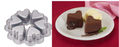
③ ミニハートベーキングパン No.55048 〈WNL-10〉 目 9-1097-0301 ¥5,800 φ230×H43 出来上がり寸法:1ヶ当り70×70×H40