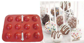
⑦ ケーキポップスパン No.43622 〈WNL-77〉 目 9-1097-0701 ¥3,800 270×205×H45 出来上がり寸法:1ヶ当りφ40 材質:アルミニウム(シリコン樹脂加工) ●球状のケーキを焼くことができます。