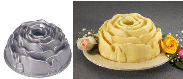
② ローズパン No.54148 〈WNL-12〉 目 9-1097-0201 ¥6,000 φ230×H100 出来上がり寸法:φ215×90