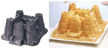
① キャッスルパン No.57724 〈WNL-50〉 目 9-1097-0101 ¥6,000 245×225×H110 出来上がり寸法:210×220×H105

ノルディックウェア社は1946年の創立以来、60年の歴史を持つ高級キッチンウェアブランドです。高度な鋳造技術により、驚くほど繊細で美しいデザインを創りあげ、単調だったケーキ型の世界をつくりかえました。美しさとともに重厚な造りを併せ持ちます。その製品は世代を越えて受け継がれ、世界の90ヶ国で愛用されています。