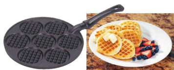
⑧ ワッフルパン ケーキパン No.01930 〈WNL-43〉 目 9-1097-0801 ¥6,500 φ270×H15 出来上がり寸法:1ヶ当り85×H10