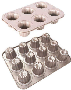
① カヌレ型天板 〈WTV-C5〉 目 NEW 9-1097-1101 6ヶ取 WK9864 266×180×H50 ¥3,400 9-1097-1102 12ヶ取 WK9158 325×258×H50 ¥4,300 出来上がり寸法:φ55×H50 材質:スチール(シリコン樹脂コーティング) 耐熱温度:230℃