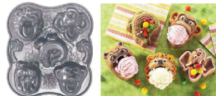
⑤ ハングリーアニマルパン No.85224 〈WNL-59〉 目 9-1097-0501 ¥5,500 245×280×H55 出来上がり寸法:かば75×100×H50