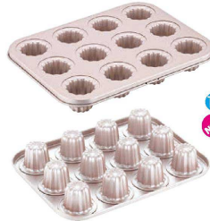
⑫ ミニカヌレ型天板 12ヶ取 WK9950 NEW 〈WTV-C6〉 目 9-1097-1201 ¥3,800 255×194×H35 出来上がり寸法:φ40×H35 材質:スチール(シリコン樹脂コーティング) 耐熱温度:230℃