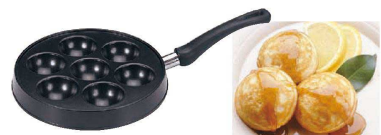
⑩ デンマークパンケーキ アイロン No.01740 〈WNL-54〉 目 9-1097-1001 ¥6,500 φ240×H35 出来上がり寸法:1ヶ当りφ60×H25